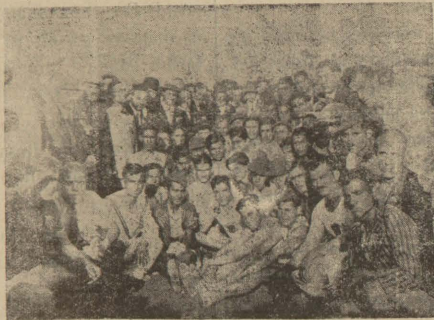
Yurdda Görülen Bu Canlılık Tarihe Karşı.

Cuma günü saat on dörtte Mersinin biricik spor kurumu olan İdman Yurdunun yıllık toplantısı yapılacaktı. Üç yüzden fazla üyesi bulunan Yurdun yasına göre konuşmaya başlamak için gerek olan çokluk bulunamadığından toplantı baş ka bir güne bırakıldı.